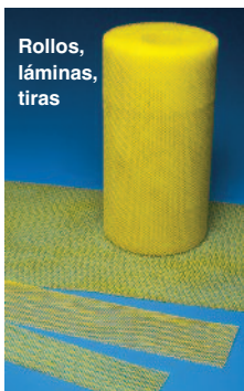
Rollos, láminas, tiras

Malla Ultra-Lath Plus con papel atrás: 27" x 96" hojas