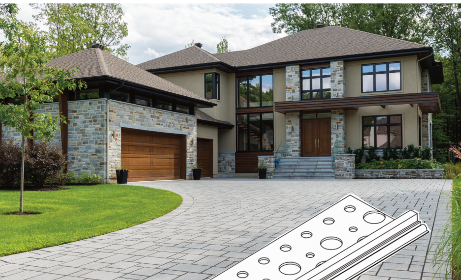
1050UCB series Patente Pendiente

Elimina múltiples pasos del proceso de construcción Las molduras de color eliminan la pintura